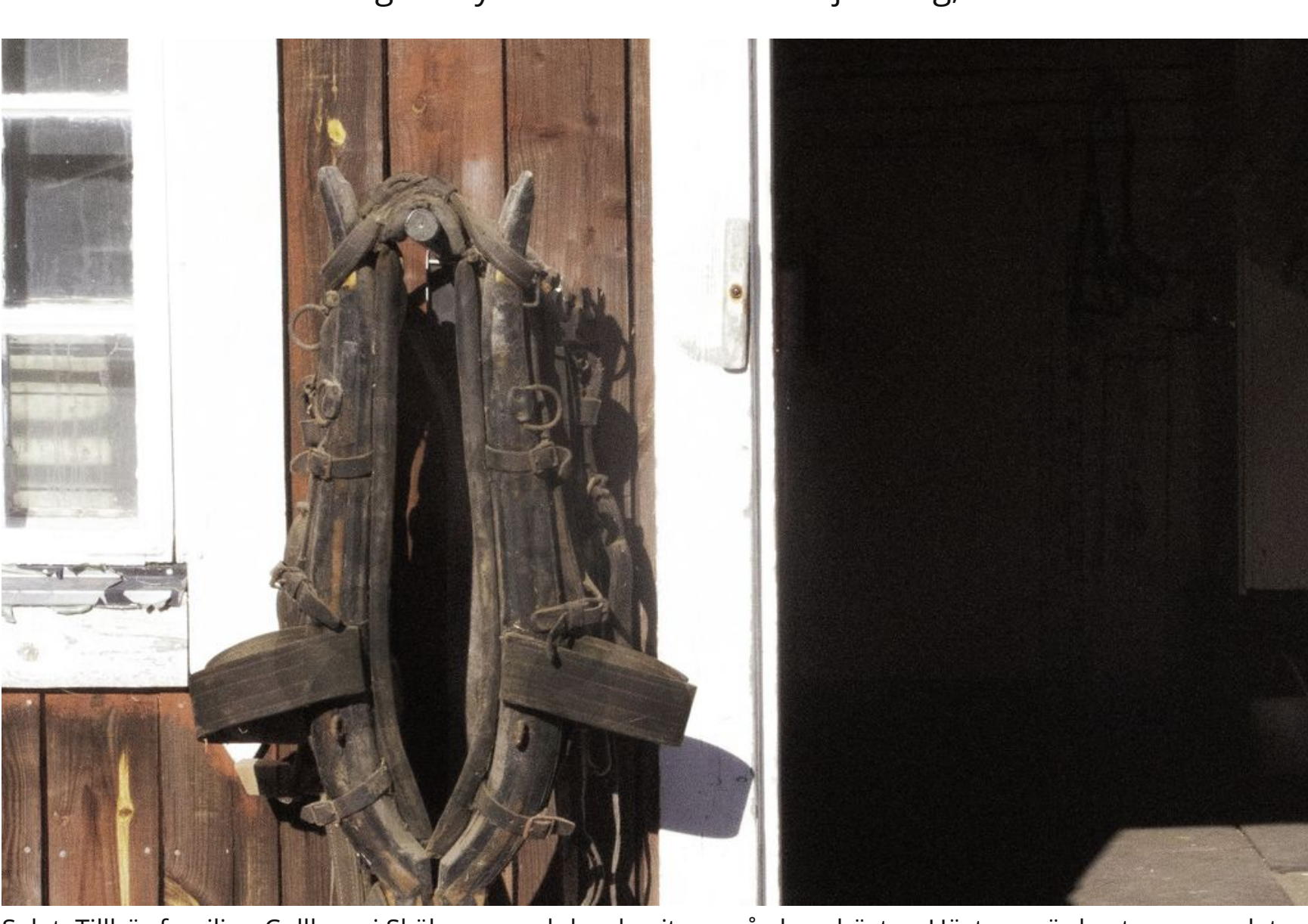
Selet. Tillhör familjen Cullberg i Skålsmara och har burits av gårdens hästar. Hästarna är borta, men selet hänger kvar på en krok i stallet.

– En historia som berört mig särskilt är den om torparfamiljen i Vedhamn. Där har jag utgått ifrån en tidningsnotis som jag hittade, från år 1899, säger Katarina. De drabbades av en tragisk olycka och fadern i familjen dog, förklarar hon.