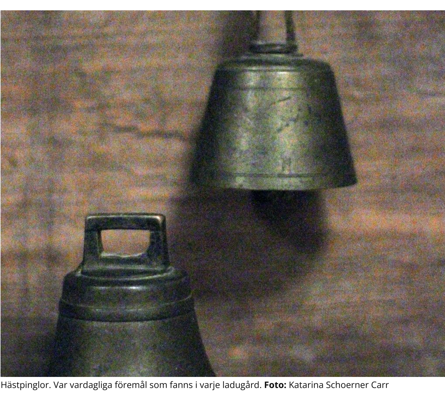
Hästupplag. Var vardagliga föremål som fanns i varje ladugård.

Många av sakerna kommer från Ingarö hembygdsmuseum, och några från privata hem. I de flesta fall har Katarina hittat fakta och berättelser i olika dokument, bland annat kyrkböcker.