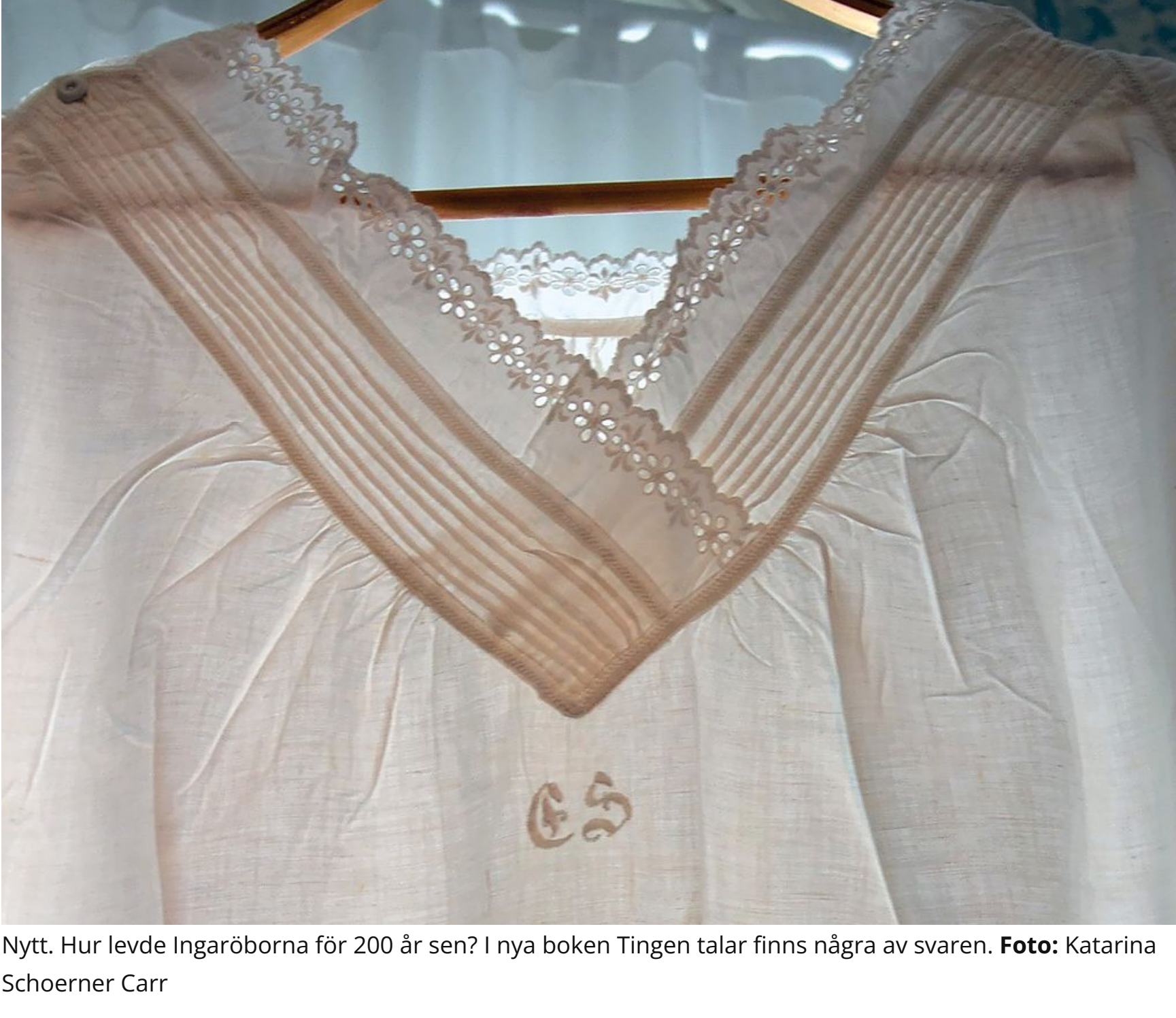
Nytt. Hur levde Ingaröborna för 200 år sen? I nya boken Tingen talar finns några av svaren.

PUBLICERAD 2023-01-25 09:00 UPPDATERAD 2023-01-25 09:02